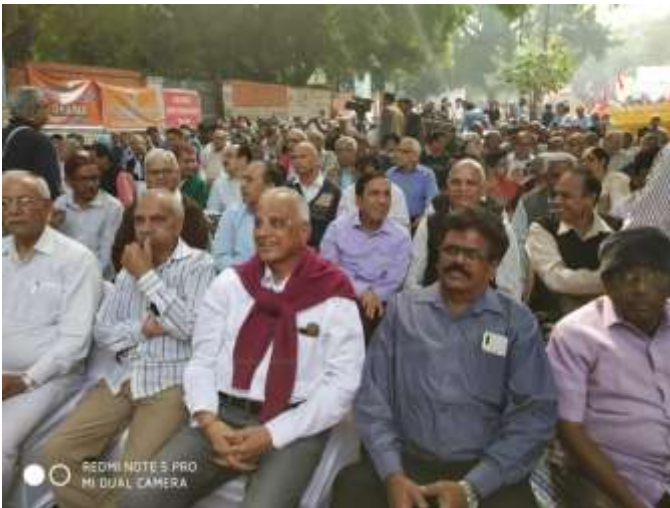
ന്യൂഡെൽഹിയിലെ ധർണ്ണയുടെ മുൻ നിര