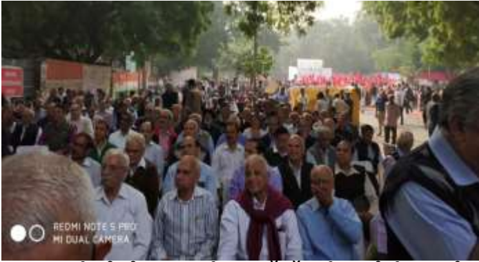
ന്യൂഡെൽഹിയിലെ പെൻഷനേഴ്സ് ധർണ്ണയിൽ അണിചേർന്നവർ